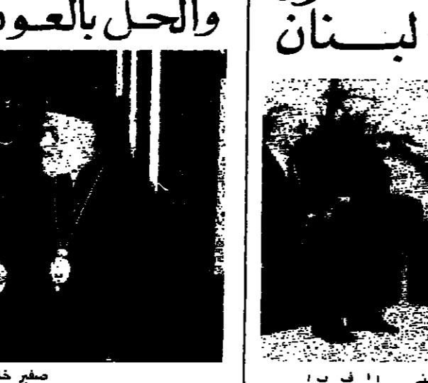
صفيح خلال زيارته لهزيمة

الهجرة: تأسف ان يكون امر الهجرة واقع، وتكونون حذرون من هذا الواقع لان هناك أعداداً كبيرة ماجروا ويهاجرون، ولا يمكننا ان نمنع الهجرة اذا كانت القاذف تتساقط على رؤوس الناس، ويعتمد عليهم تلك المال والعمل، والخبر من الهجرة يكون بالعودة الى الحالة الطبيعية، بل ان يكون هناك معارك وان يعود الناس الى بعضهم البعض، وان تعود الدولة وتحترم امراها وتقرض ميثاقها وحبية القانون على الجميع، اعتمدت اكثر من مرة ان المؤامرة في لبنان هي مؤامرة بولية، حل ما زالت على هذا الرأي.